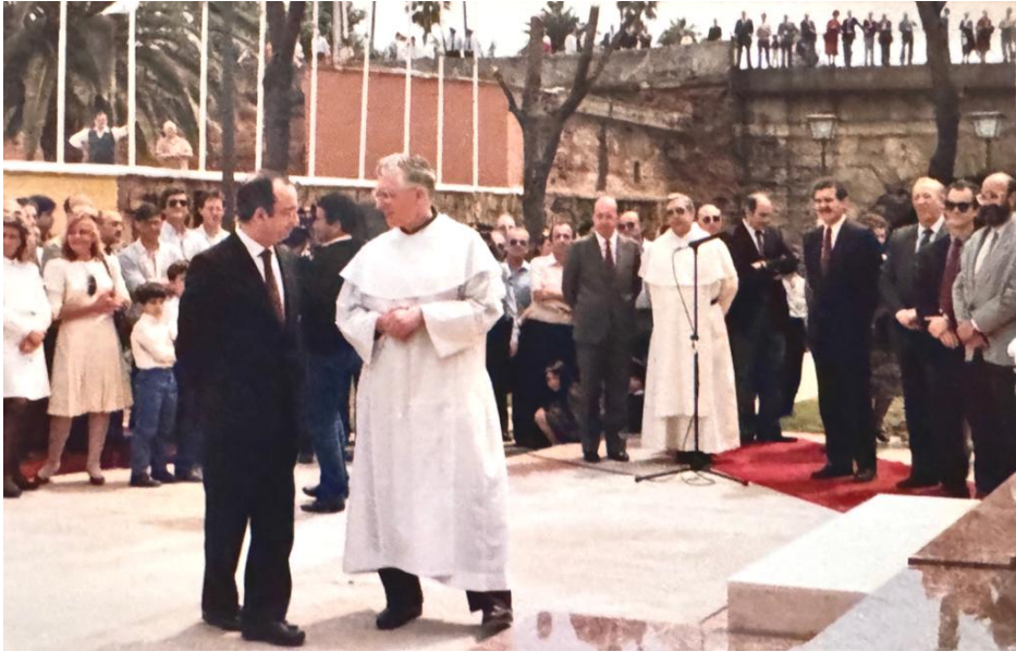
Arriba: Inauguración del Monumento a fray Bartolomé de las Casas en la Cartuja con asistencia del maestro Damián Byrne (1991). Abajo: Visita canónica del maestro Timothy Radclife.1997.