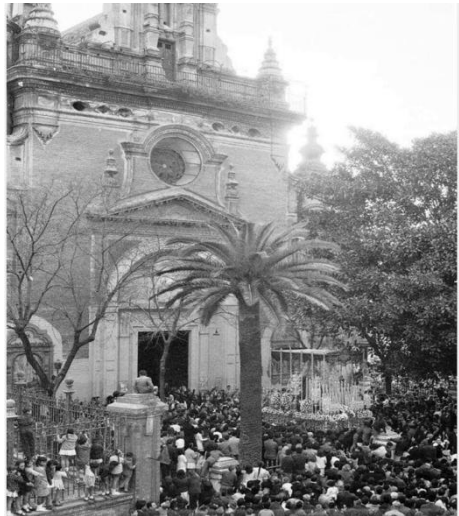
Derecha: altar de cultos del Simpecado del Rocío a finales de los 60. Izquierda: salida de la Virgen en 1963