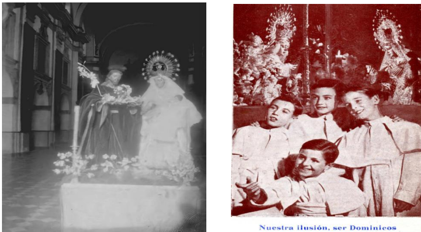
Nuestra ilusión, ser Dominicos

En la década de los 60 todavía estaban vigentes las antiguas devociones dominicanas junto a las cofradías: Antigua foto de la procesión claustral de la Candelaria y estampa vocacional.