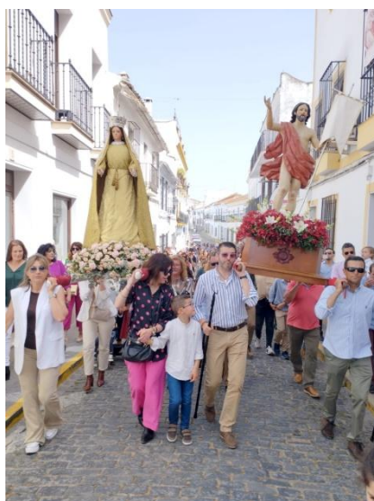
Valencia del Ventoso. Regreso de la Procesión.