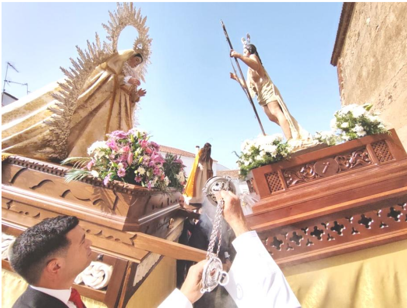
Fregenal de la Sierra. Ceremonia del Encuentro y Abrazo.