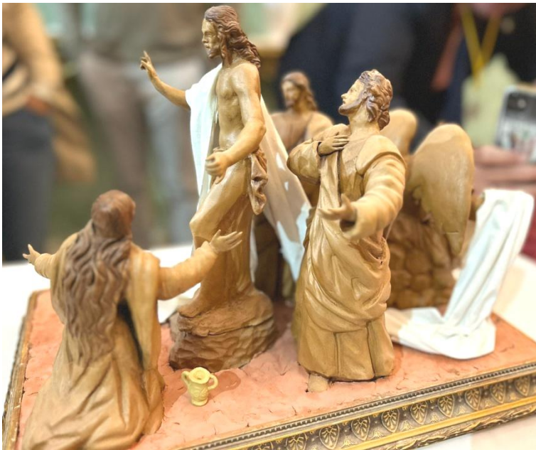
Badajoz. Boceto del Misterio de la Resurrección, de Israel Cornejo.