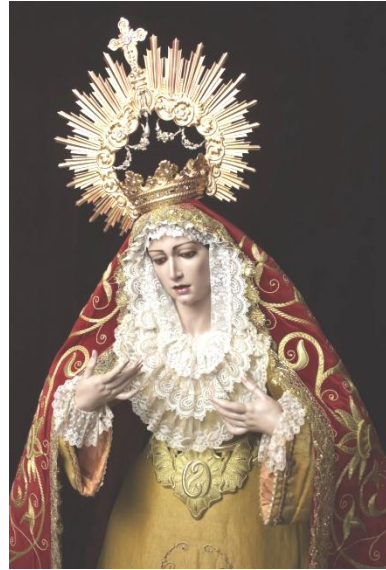
Badajoz. Nuestra Señora de la Aurora, Madre de la Iglesia.