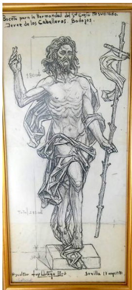
Jerez de los Caballeros. Boceto de Ortega Bru para la imagen del Resucitado