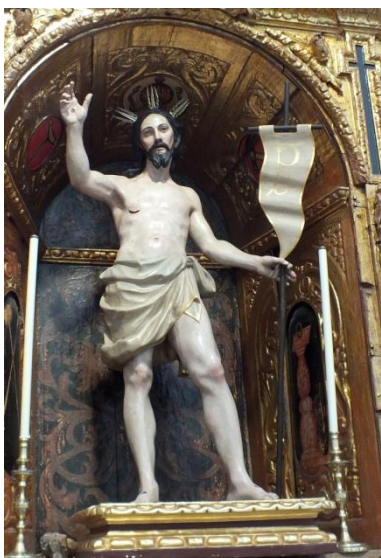
Villafranca de los Barros. Cristo Resucitado.