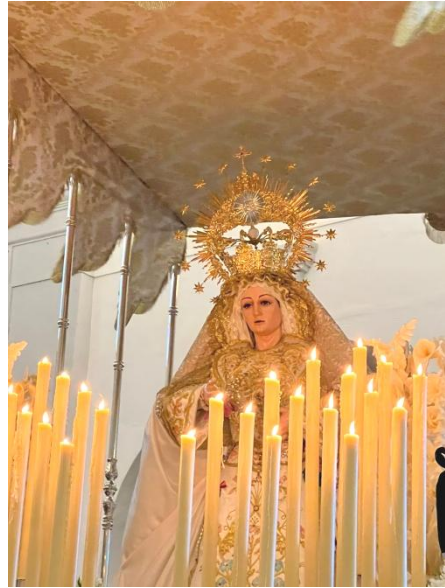
Fuente de Cantos. María Santísima de la Paz.