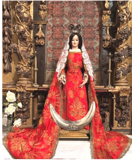
Ribera del Fresno. Nuestra Señora del Rosario.