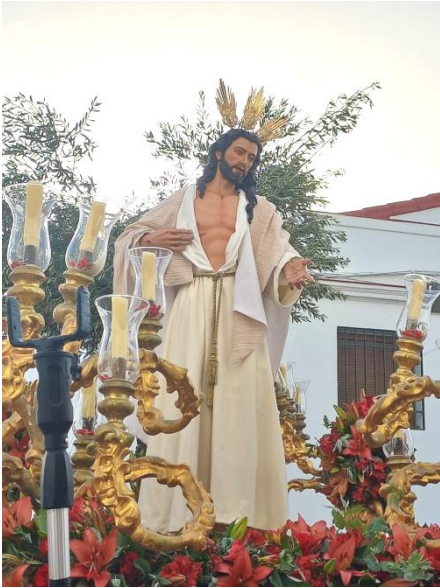
Fuente de Cantos. Nuestro Padre Jesús de la Victoria.