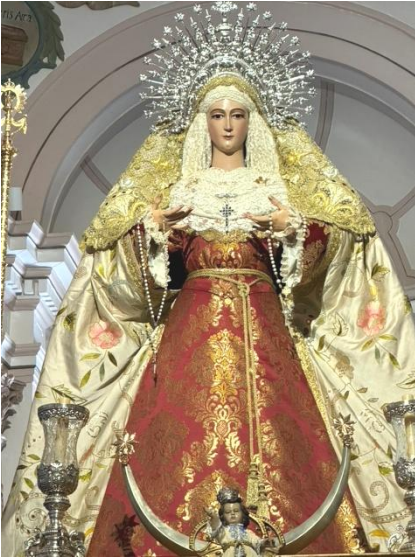
Jerez de los Caballeros. Nuestra Señora del Rosario.