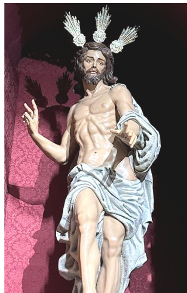
Jerez de los Caballeros. Cristo Resucitado.