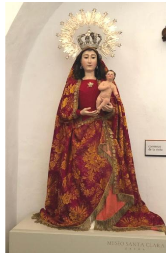
Zafrá. Nuestra Señora de los Remedios.