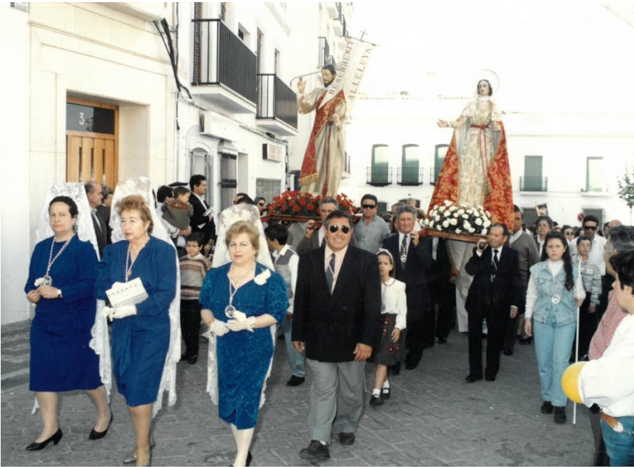
Villafranca de los Barros. La procesión de antaño.