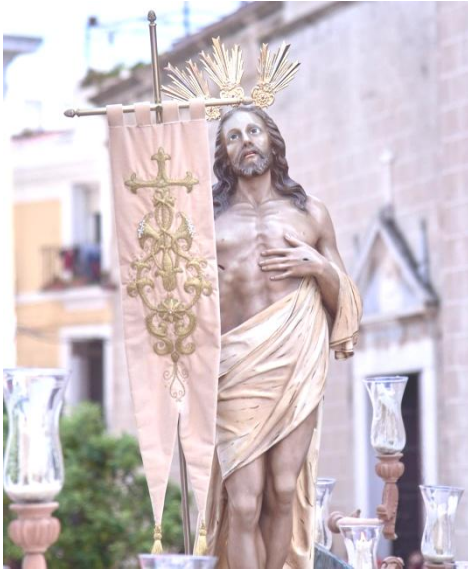
Badajoz. Actual imagen de Jesús Resucitado, de Santiago Arolo.