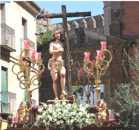
Zafrá. Procesión de Cristo Resucitado.