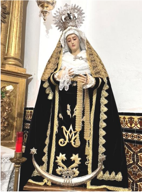
Bodonal de la Sierra. Nuestra Señora de los Dolores.