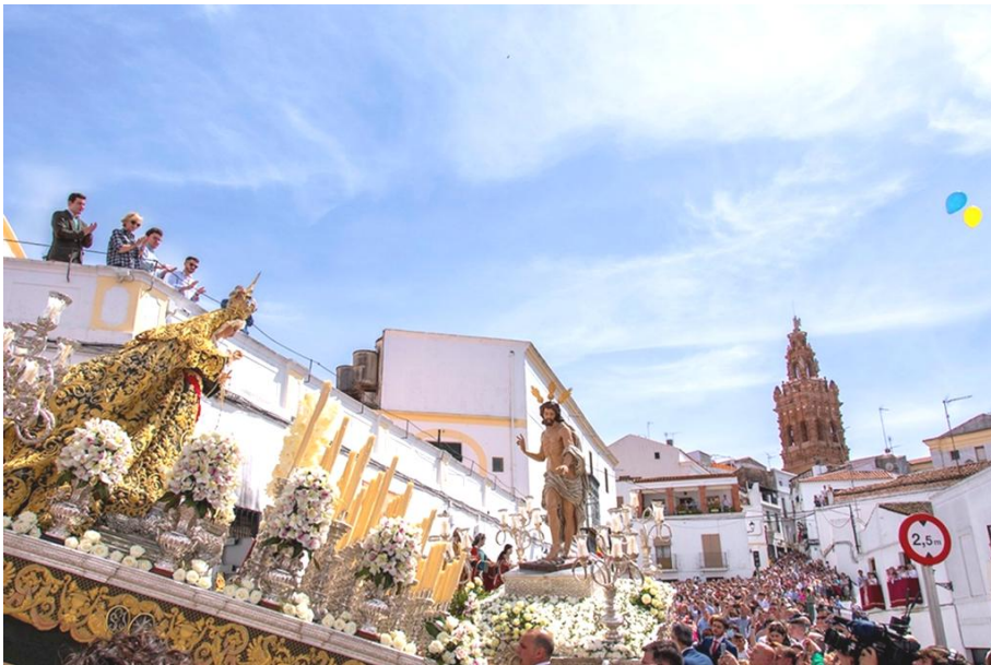
Jerez de los Caballeros. Ceremonia del Encuentro.