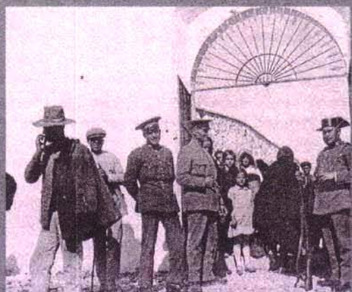
Desigualdad social. Vecinos de Estepa aguardan en la cola de racionamiento durante la posguerra.