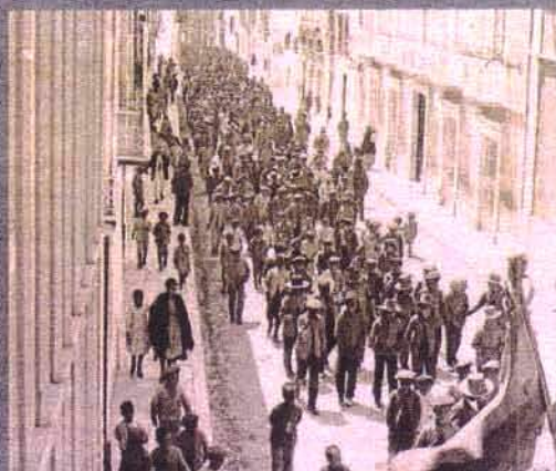
Tensiones. La comarca ha sido testigo de numerosas revueltas populares durante los siglos XIX y XX.