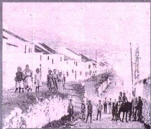
Pobreza. La vida en los núcleos rurales fue muy dura hasta bien entrada la segunda mitad del pasado siglo.