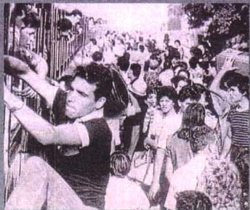
Lejos de su hogar. La Sierra Sur ha sido una de las comarcas sevillanas más afectadas por la emigración.

Pero a la espera de la culminación de la presente edición, Ascil comienza a perfilar la comarca a la que prestará atención el próximo año. Según adelanta José Antonio Filter, "posiblemente el Bajo Guadalquivir sea la zona elegida en la que se centrarán las ponencias y estudios de la próxima edición de las jornadas. De esta forma, la novena edición podremos hacerla coincidir con actos tan importantes como la conmemoración del bicentenario de la proclamación de la Constitución de Cádiz de 1812".