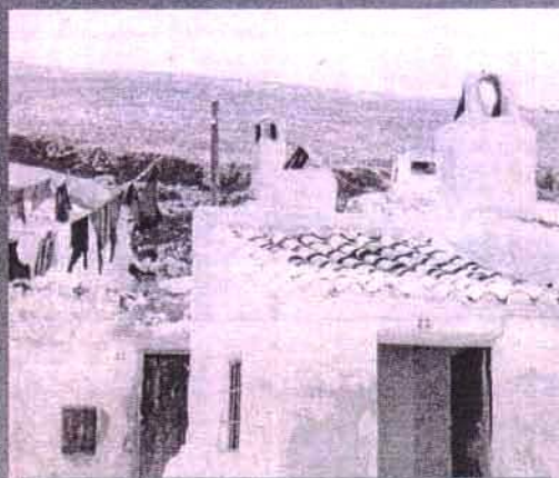
Formas de vida. En la imagen, alguna de las cuevas habitadas durante siglos por vecinos de Estepa