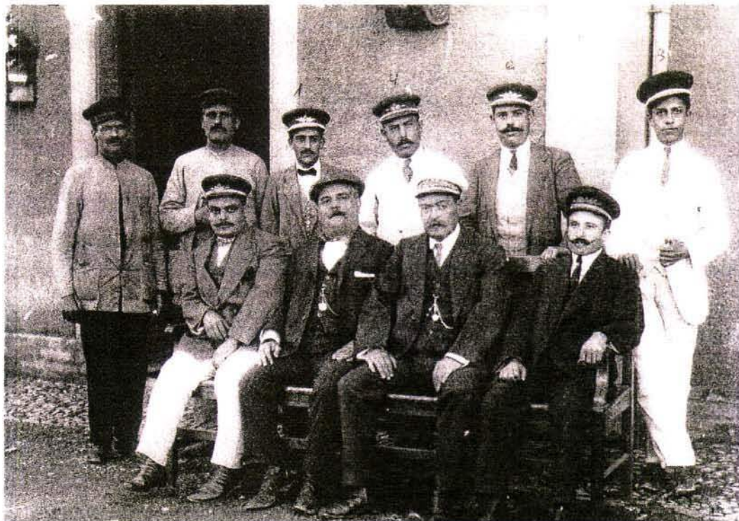
Algunos de los trabajadores de la estación de ferrocarriles de La Roda de Andalucía a finales del siglo XIX.